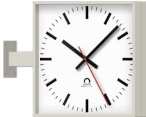
FLQ.Ø.SET Wand- und Deckenset Aufschnappmontage aus Stahl.