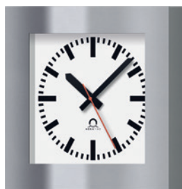
N Montage mural