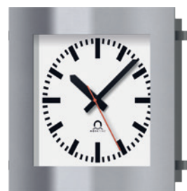
F Montage encastré