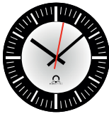
esfera 000 (LED)