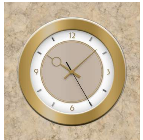
Personalizado FLEX Ø30, una cara, con esfera y agujas personalizadas, en caja de montaje (ED)