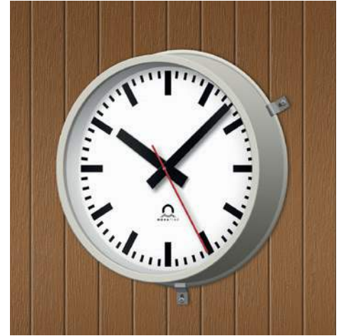
Gimnasio FLEX Ø30, una cara, esfera 120, cubierta de cristal y caja resistentes a los golpes, con abrazaderas de montaje (MK)