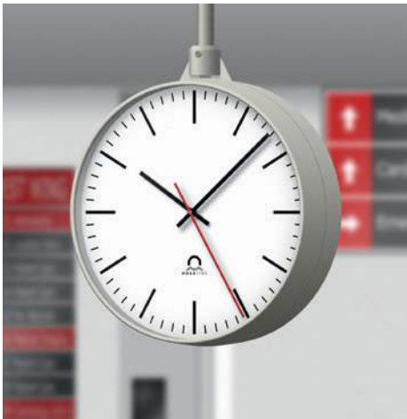
Hospital FLEX Ø30, doble cara, esfera 160, con soporte de fijación al techo de 50 cm (DS.50)