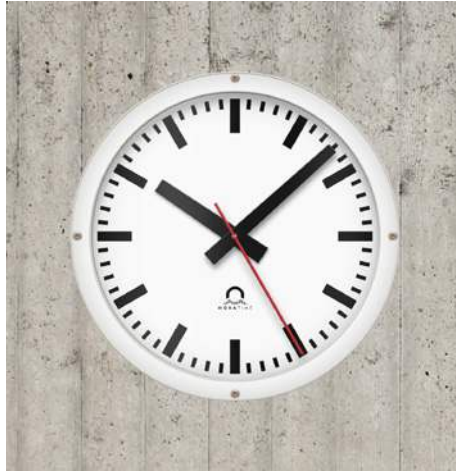
Escuela FLEX Ø30, una cara, esfera 120, en caja para hormigón (BD)