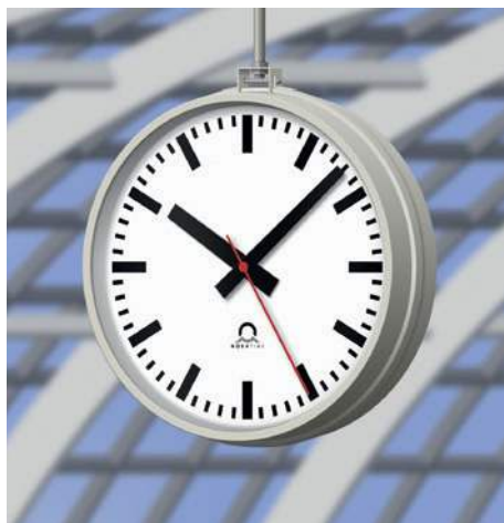
Estación de tren FLEX Ø60, doble cara, esfera 120, con soporte de fijación al techo de Ø60-80 (DS)