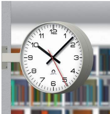
Biblioteca FLEX Ø30, doble cara, esfera 210, con soporte de fijación al techo y pared (WS)