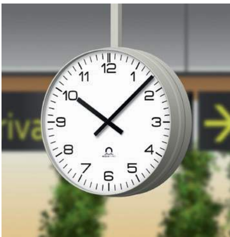
Aeropuerto FLEX Ø50, doble cara, esfera 210, con soporte de fijación al techo de Ø50 (DS)