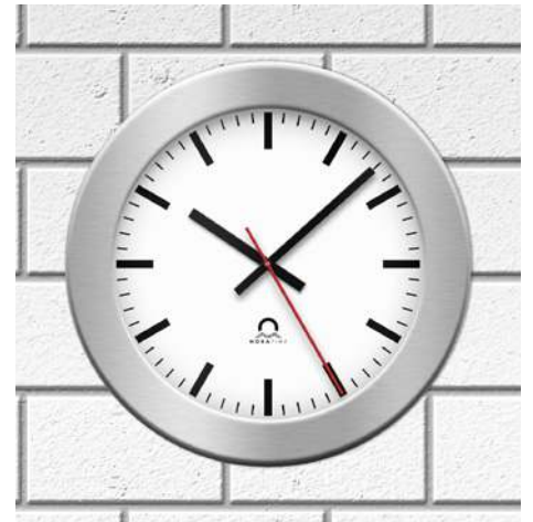
Oficina FLEX Ø30, una cara, esfera 200, en caja de montaje (ED)