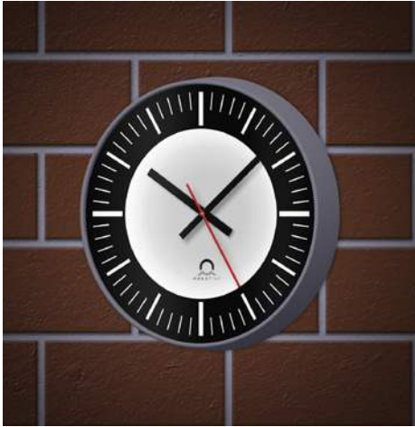
Fábrica FLEX Ø30, una cara, iluminado, esfera 000