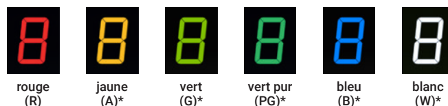
rouge (R) jaune (A)* vert (G)* vert pur (PG)* bleu (B)* blanc (W)*

L'arrière-plan de l'écran est noir et offre un contraste d'affichage optimal avec un angle de vue de 160 degrés. La couleur des chiffres est sélectionnable. Voici les variantes disponibles :