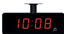
N.S Suspension au plafond simple face