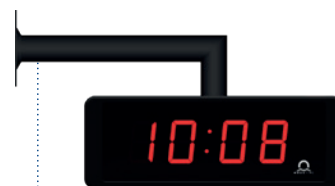
N.B Fixation avec console murale simple face